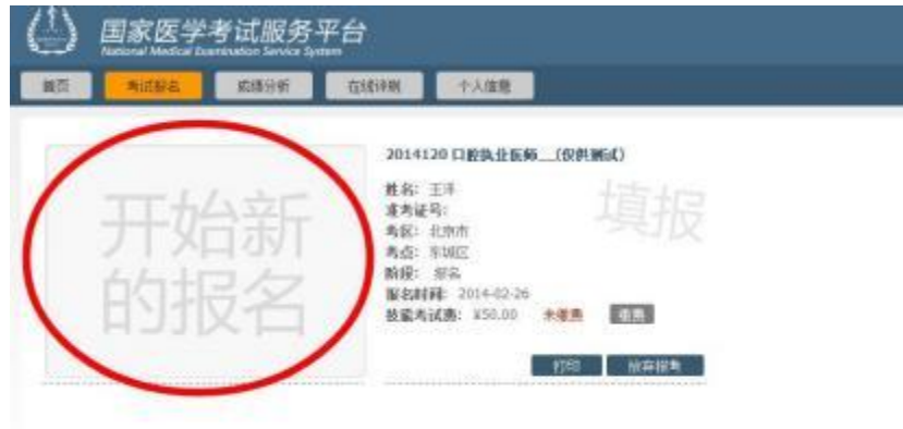
图示为考试报名模块的显示效果

页面左首显示为“开始新的报名”，点击“开始新的报名”即可开始进行报名操作。同时在右侧会顺序列出在考试平台中曾经报考的考试项目及基本情况。注意：报名信息不提供修改功能，请务必检查自己所报考的考试科目，考区/考点是否正确；如发现报考有误，在网上报名期间，可通过报考项目方框右下方的“放弃报考”予以放弃，然后重新“开始新的报名”进行报名。