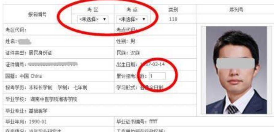
110 临床执业医师__(仅供测试) 考试报名暨授予医师资格申请表

最后需要用户再次检查本次报名信息并选择报考的考区和考点；然后上传符合要求的近期白底证件照（小于 30K），完成后点击提交按钮即可结束报名，跳转回考试报名模块，选择打印申请表或其他操作。