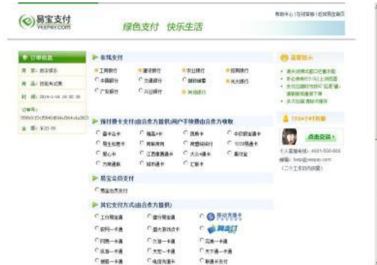
图示：通过网银缴费