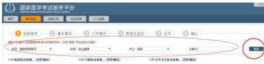
图示通过筛选条件快速寻找考试科目

开始报名后，首先需要选择报考考试科目（医考考试即为考试类别/级别）。由于考试科目繁多，用户可通过设置页面顶部的筛选条件进行检索。